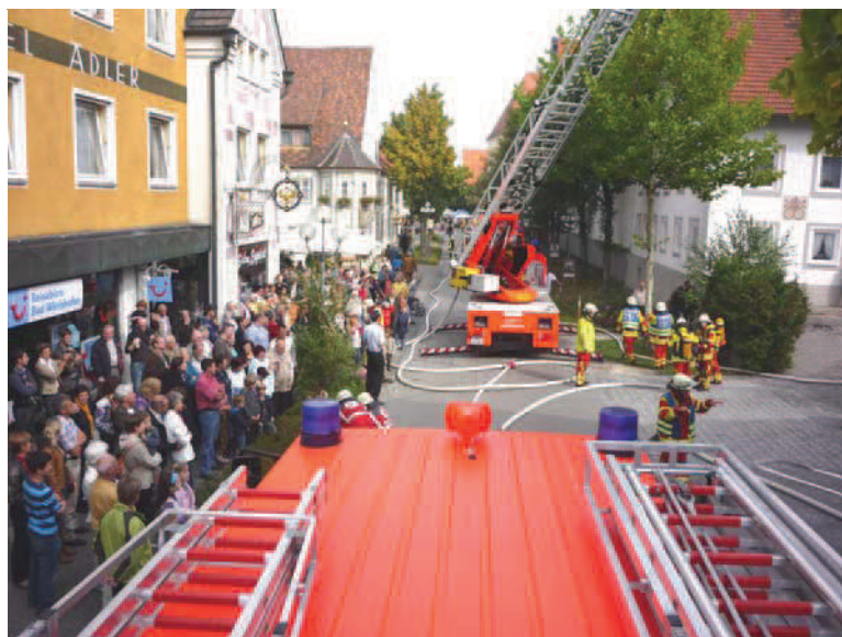
20.09.2009: Bei einer Schauübung im Rahmen der Kulinarischen Meile wurde den zahlreichen Zuschauern von der Jugendfeuerwehr mit Unterstützung der aktiven Einsatzkräfte die Leistungsfähigkeit der Freiw. Feuerwehr Bad Wörishofen demonstriert.