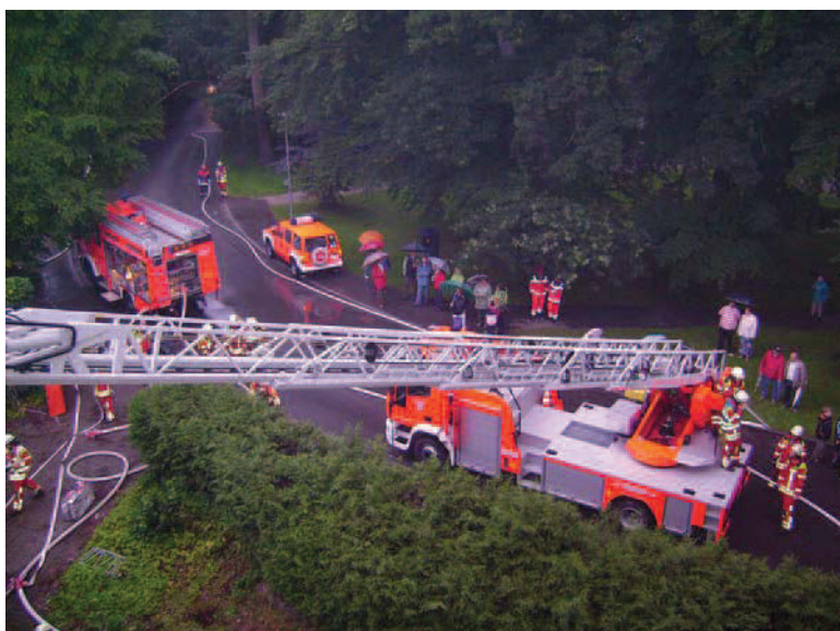
23.07.2009: Einer der Übungsschwerpunkte bei der Hauptübung im Kurparksanatorium war der Innenangriff über mehrere Stockwerke durch Atemschutzgeräteträger sowie der Aufbau der Wasserversorgung für mehrere Löschfahrzeuge an der Einsatzstelle.