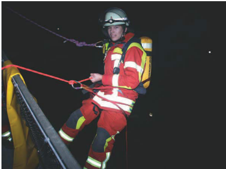
20.04.2009: Die Selbstrettung von Atemschutzgeräteträgern war im abgelaufenen Übungsjahr eine der Übungsthemen für die Übungsgruppe Absturzsicherung.