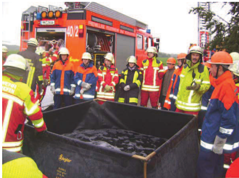
23.06.2009: Bei einer Übung am Flugplatz Bahle wurde mit der Jugendfeuerwehr die Wasserversorgung mit Übergabebehältern geübt.