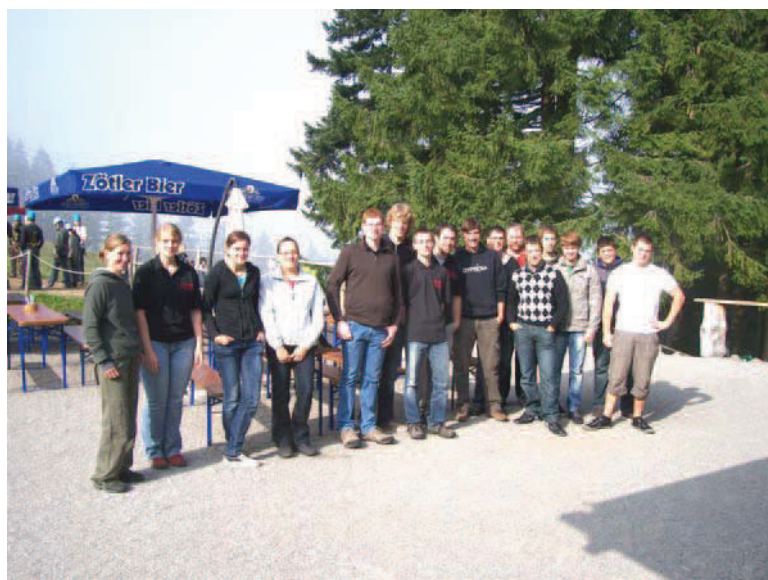
26.09.2009: Der Ausflug der Jugendfeuerwehr führte die Jugendlichen mit ihren Betreuern zum Klettergarten nach Immenstadt.