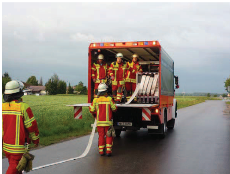
22.06.2009: Übungsaufgabe Wasserförderung - im Rahmen einer Übung wurde mit dem Versorgungs-Lkw eine lange Schlauchleitung verlegt.